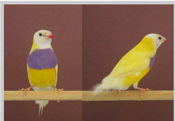
Foto 1 - Exemplar Amarelo de peito roxo, com dorso bem limpo

Amarelo Peito Roxo: temos em nossos plantéis uma linhagem de pássaros peito roxo cabeça preta, portadores de azul, que foram cruzados com amarelo peito