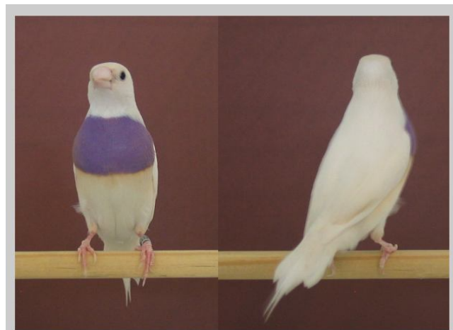
Foto 1 - Exemplar Branco de peito roxo, com dorso bem limpo

Branco Peito Roxo: os brancos, eram chamados de prateados, devido a grande infiltração de melanina que possuíam em seu dorso dando uma cor cinza azulada. Atualmente pelo trabalho de seleção realizado estamos conseguindo chegar no padrão desejado, de dorso bem branco com peito bem roxo.